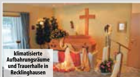
klimatisierte Aufbahrungsräume und Trauerhalle in Recklinghausen