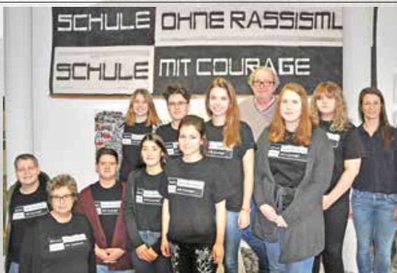
Projektgruppe „Schule ohne Rassismus – Schule mit Courage“