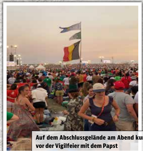
Auf dem Abschlussgelände am Abend kurz vor der Vigilfeier mit dem Papst

„Die Stimmung beim Abschluss war einfach einzigartig. Die vorherigen Veranstaltungen waren dagegen kein Vergleich. Alle hatten gute Laune und viel Spaß. Das war eine Erfahrung, die man sonst so nie machen kann.“